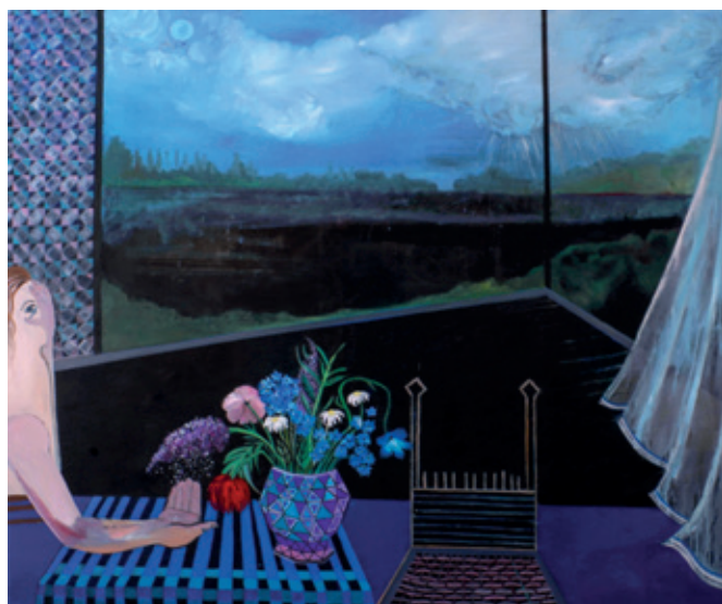
Yasmine Willems, Einde van de zomer , 2020, acryl- en olieverf op doek, 200 x 230 cm. Met toestemming van de kunstenaar en Shoobil Gallery. Prijs: € 4.300.