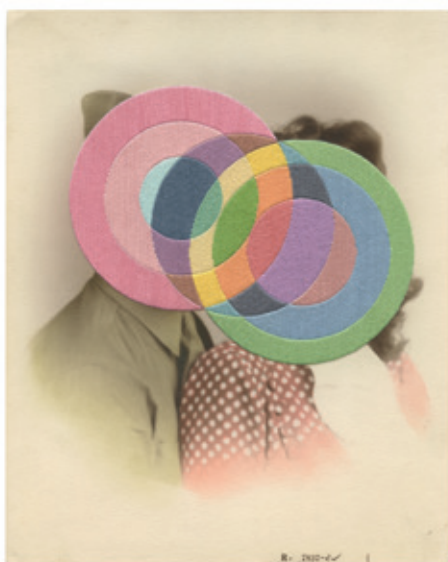
Julie Cockburn, Candy Crushed , 2020, broderie à la main sur photo trouvée, 25,2 x 20,2 cm.