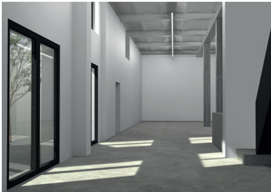
Vue de synthèse du nouvel espace molenbeekois de Harlan Levey Projects.

+++ Après une longue attente, Le Louvre vient enfin de mettre en ligne la quasi totalité de sa collection, soit 482 000 pièces. Seules 30 000 entrées environ étaient auparavant accessibles au public. L'institution effectue en ce moment d'intenses recherches sur la provenance de ses collections, notamment relatives aux pillages nazis et coloniaux. Ses conclusions seront probablement ajoutées à cette base extensive, en facilitant sans doute l'accès aux ayants-droits et à d'éventuelles restitutions. A quand une pratique similaire en Belgique ? +++ A Bruxelles, fermés en