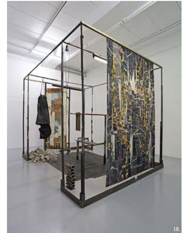
12-16 — Head in the Sand , 2015, bois, plaque de plâtre, verre, acier, béton, grenade fumigène, vue de l'installation et documentation de la performance à la galerie Leto, Varsovie, Pologne / wood, plasterboard, glass, steel, concrete, smoke grenade, installation view and performance documentation at Leto Gallery, Warsaw, Poland, courtesy of Leto Gallery, Harlan Levey Projects and the artist 17&18 — Akumulator , 2013 - 2018, acier, bois, ruban médical, peinture acrylique, miroir, néon, papier, cuir, silicone, téléphone portable, vue de l'installation / steel, wood, medical tape, acrylic paint, mirror, neon light, paper, leather, silicon, cell, phone, installation view, Harlan Levey Projects, Brussels (BE), courtesy of Harlan Levey Projects and the artist