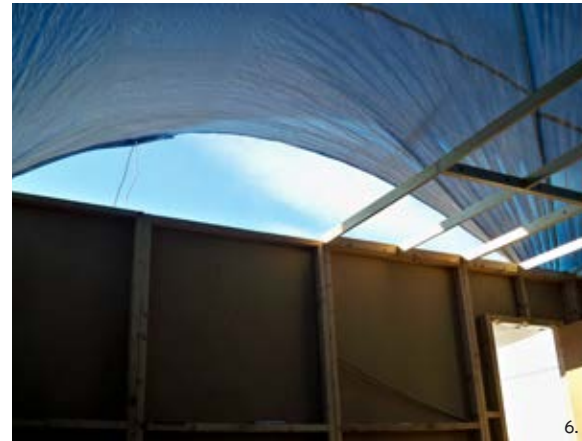
3-8 — Screen House, 2010, vue de l'installation sur le toit du Hive Project Space, Londres, palettes en bois, contreplaqué, panneaux de particules, tubes au néon et acier galvanisé ondulé / installation view on the roof of Hive Project Space, London, wooden pallets, plywood, chipboard, neon tubes and corrugated galvanized steel